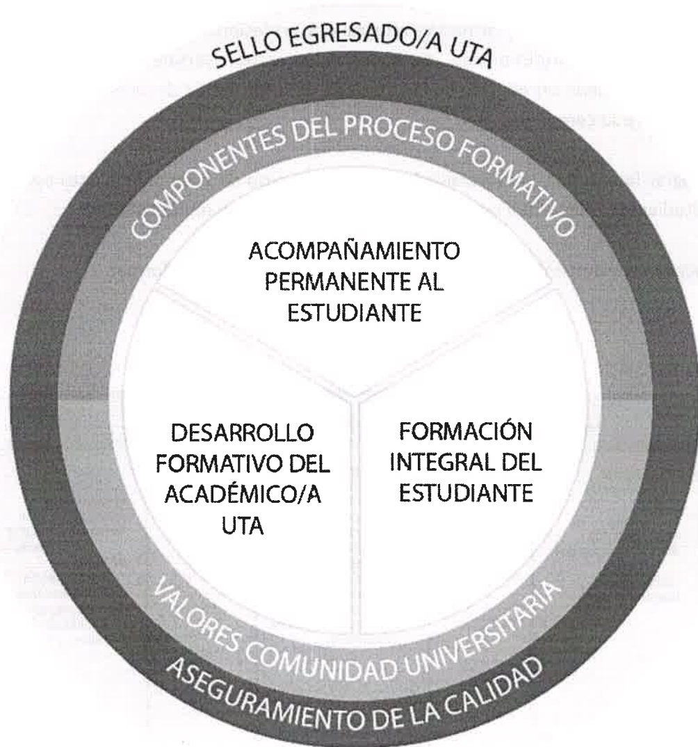
Figura 1: Modelo Educativo

El Modelo Educativo de la Universidad de Tarapacá define su quehacer docente como un proceso de transformación del estudiante en un profesional integral. Este proceso se sostiene sobre tres grandes pilares, autónomos e interdependientes entre sí: el acompañamiento permanente a los estudiantes, la formación integral del estudiante, el desarrollo formativo del académico/a.