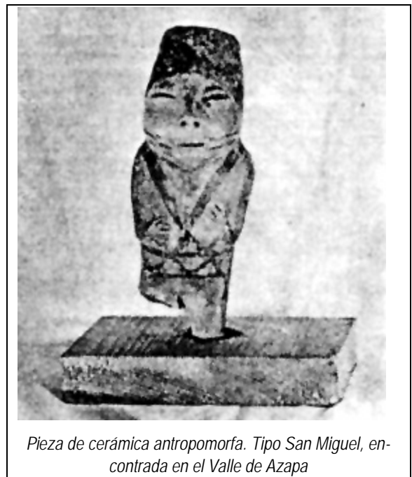
Pieza de cerámica antropomorfa. Tipo San Miguel, encontrada en el Valle de Azapa

Las azuelas están confeccionadas con ramas torcidas, que tienen la forma adecuada para sujetar una pieza metálica.