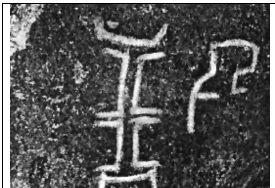
Otro de los petroglifos hallados en Conanoxa, valle de Camarones

Como en los petroglifos, también los geoglifos tienen elementos decorativos que se limitan preferentemente a las figuras antropomorfas, zoomorfas, astros, elementos geométricos y abstractos. Su ubicación en el tiempo es difícil y la correlación con los períodos culturales todavía no es clara. En todo caso se hace indispensable