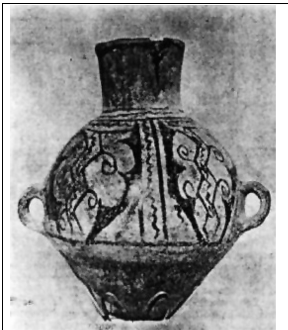
Pieza cerámica del tipo San Miguel, Valle de Azapa. Es un jarro para agua.

En la metalurgia se pueden citar los tumis de cobre o bronce,