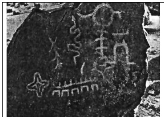
Petroglifo correspondiente a la región de Conanoxa, Valle de Camarones.

Entre los instrumentos de pesca y caza, se pueden citar los anzuelos de cactáceas, las líneas de algodón, las plomadas de piedra pizarra en forma de cigarro, y las costillas de lobos marinos con la punta agudizada para desprender los mariscos de las rocas. Con el