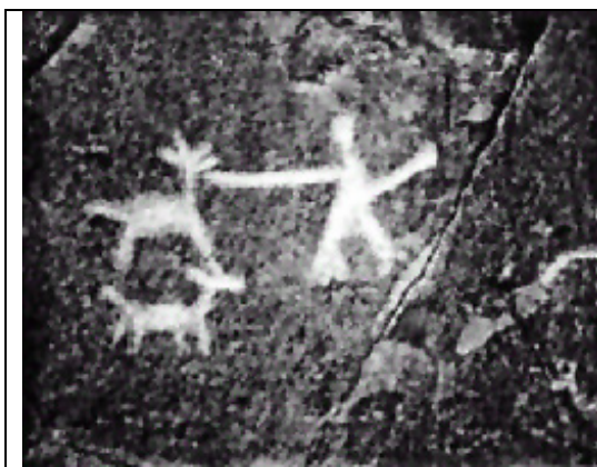
Petroglifo encontrado en el Cerro Chuño, junto a la entrada del Valle de Azapa.

Los petroglifos son manifestaciones artísticas grabadas en piedras sueltas y en bloques y paredones rocosos, que abundan en los valles y quebradas del departamento. Según su confección se pueden diferenciar varias técnicas: el simple rayado, el punteado y las figuras en bajo relieve. Los elementos decorativos se pueden dividir en figuras antropomorfas, zoomorfas, geométricas, figuras de astros