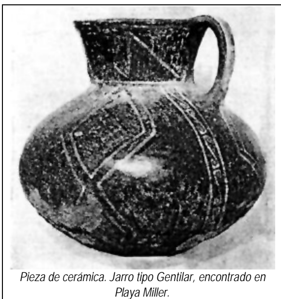
Pieza de cerámica. Jarro tipo Gentilar, encontrado en Playa Miller.

Las jarras pueden ser globulares, con cuello cónico invertido y asa plana; también las hay de forma achatada o semicilíndrica, pero que conservan el mismo cuello y asa de la anteriormente descrita. Todas las jarras presenten diferentes tamaños, están decoradas con