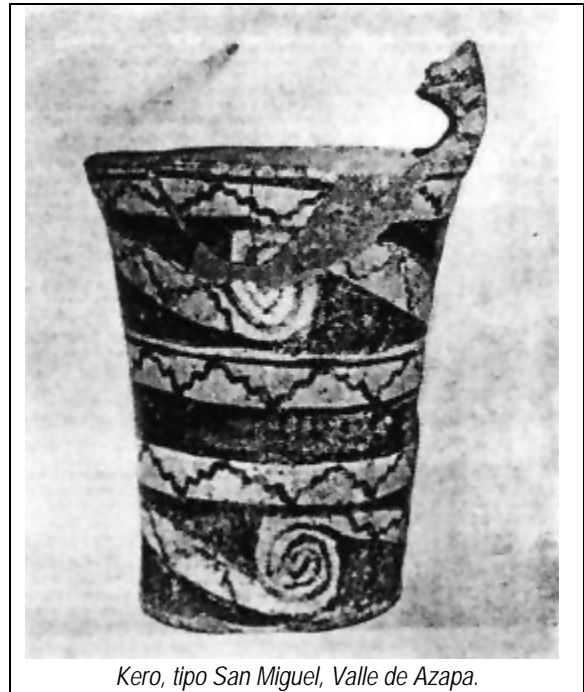
Kero, tipo San Miguel, Valle de Azapa.

La cerámica Las Maytas tiene forma de jarra globular, con la parte interior cónica, y es de base plana. Su cuello es recto y con