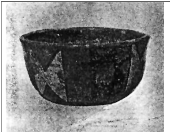
Pieza cerámica, encontrada en los faldeos del Morro de Arica. Es un puco del tipo Tiahuanacoide.

Bird, basado en las excavaciones estratigráficas que efectuó en Arica y Pisagua, postula dos períodos: