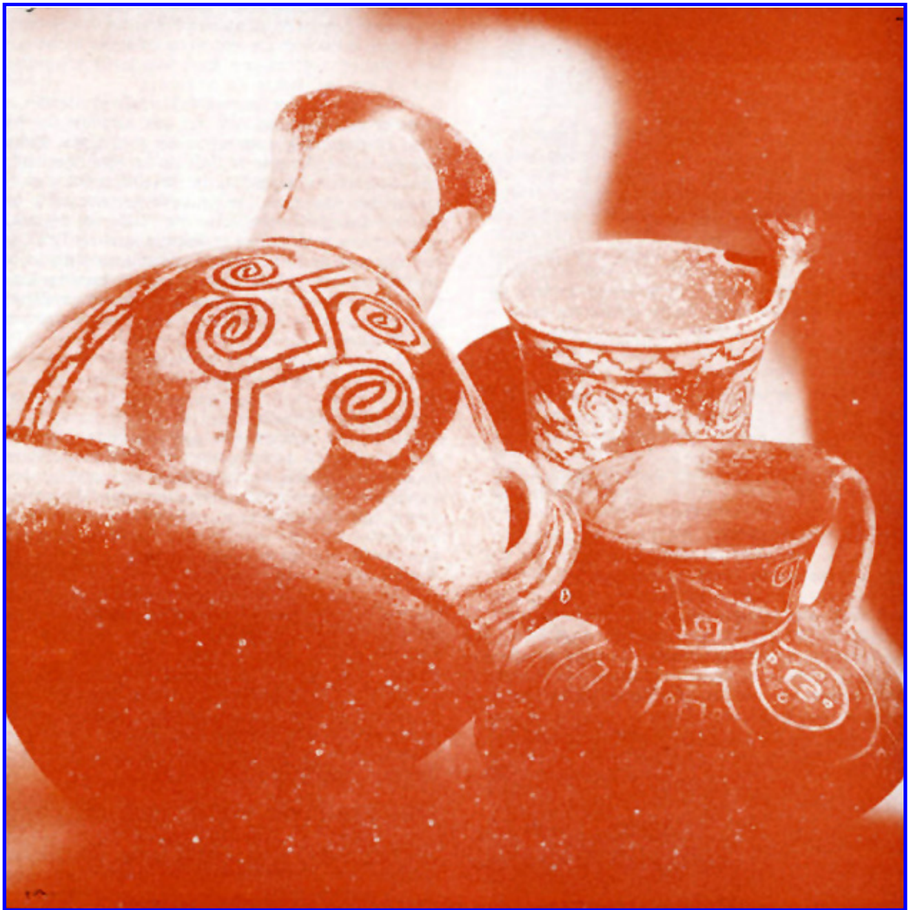
Ceramics del Desarrollo Local: Kero y cántaro del tipo San Miguel, jarro del tipo Gentilar.