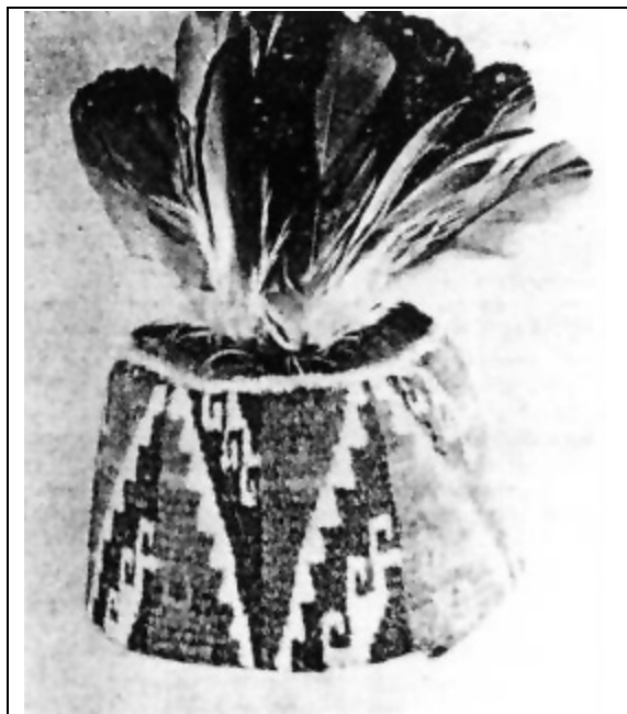
Gorro con adornos de plumas. Corresponde al Período Inca. Hallado en Alto Ramírez, Valle de Azapa.

Este sitio se ubica en la costa, a unos tres kilómetros al sur de Arica, frente a la actual Hostería. Consta de una serie de sepulturas ubicadas en amontonamientos de restos de vegetales, y están tapadas con cañas y boras. Generalmente se encuentran marcadas con gruesos maderos y cavadas en la tierra. Las momias están acucilladas, envueltas en mantas y tienen turbantes. El ajuar se compone de cestos tejidos en forma muy apretada, lo cual les da una terminación fina y, en muchos casos, tienen una decoración geométrica. Entre el